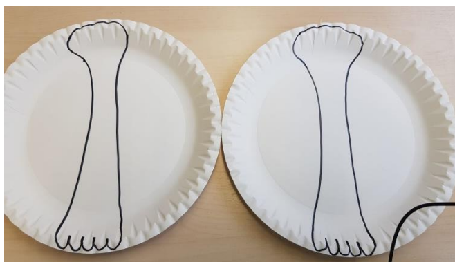
Hände und Füße auch jeweils zwei Stück

Habt Ihr die Knochen auf die Teller gezeichnet, geht es ans ausschneiden.